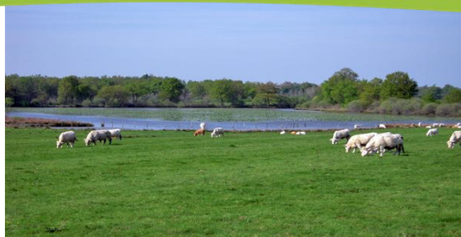
Romain Riols - LPO Auvergne